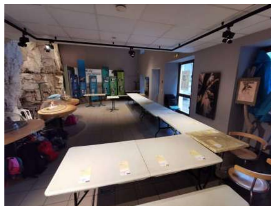
Disposition en L